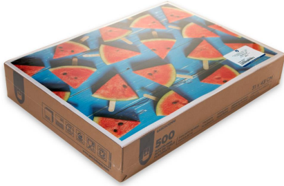
Imagen de paquete