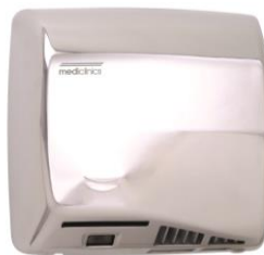
M17AC Acabado brillante