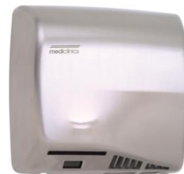
M17ACS Acabado satinado