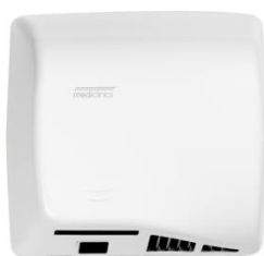
M17A Acabado blanco