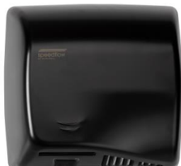
M17AB Acabado negro mate