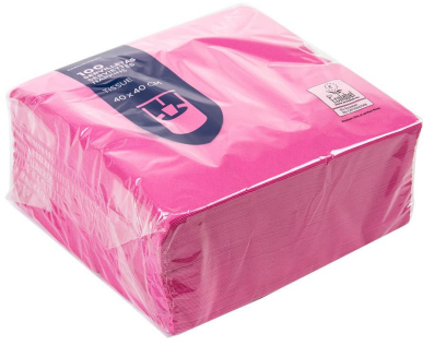
Imagen de paquete