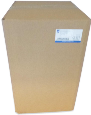
Imagen de paquete