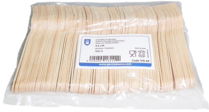
Imagen de paquete