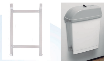
Ref. 04593 Soporte pared contenedor "For Lady"

"La información aparecida en esta Ficha Técnica se tiene como cierta y correcta. No obstante, la exactitud total de esta información así como cualquier sugerencia o recomendación se hace sin garantía. Dado que las condiciones de uso están más allá del control de nuestra empresa, es responsabilidad del usuario determinar las condiciones para un uso seguro de este producto."